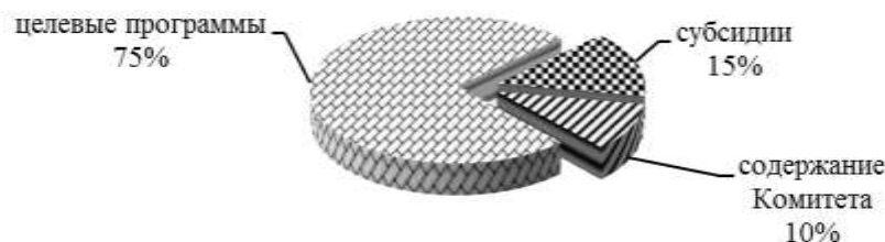
Диаграмма № 1

Таким образом, наибольший удельный вес расходов Комитета (75%) составили расходы по целевым программам. На содержание Комитета приходится 10%.