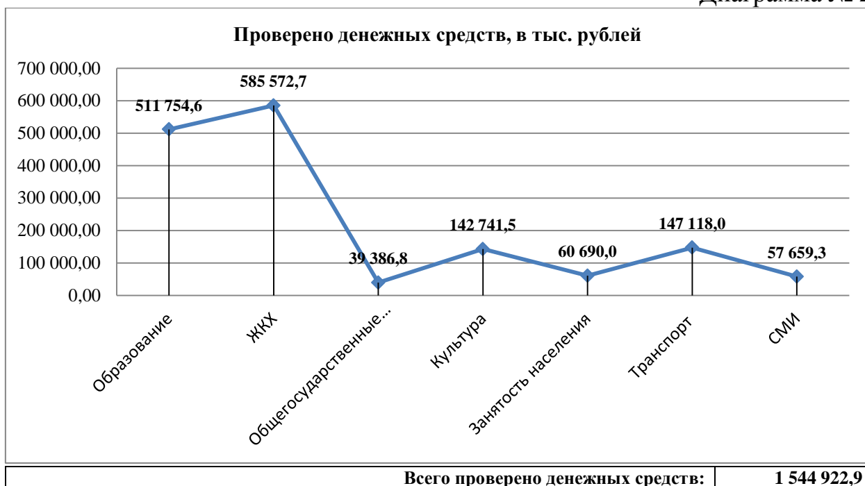
Диаграмма № 2

Информация по объемам проверенных денежных средств в разрезе источников финансирования представлена на диаграмме № 3.