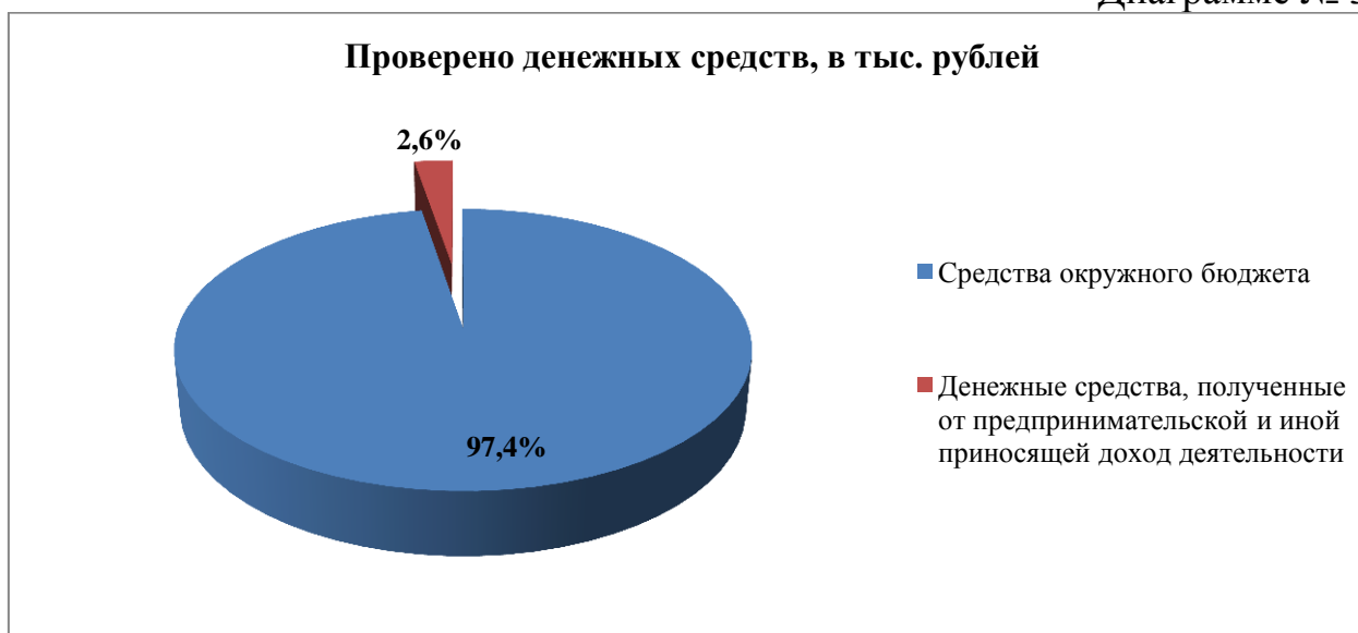
Диаграмме № 3

Таким образом, объем охваченных контрольными мероприятиями средств составил 1 544 922,9 тыс. рублей. Как и в предыдущие годы, основную долю из них составляют средства окружного бюджета - 97,4 %.